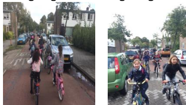
Het ging hartstikke goed. Top!

Op dinsdag 19 september ging de kinderen van groep VLW 5/6 voor het eerst op de fiets van de Von Liebigweg naar de Hogeweg.